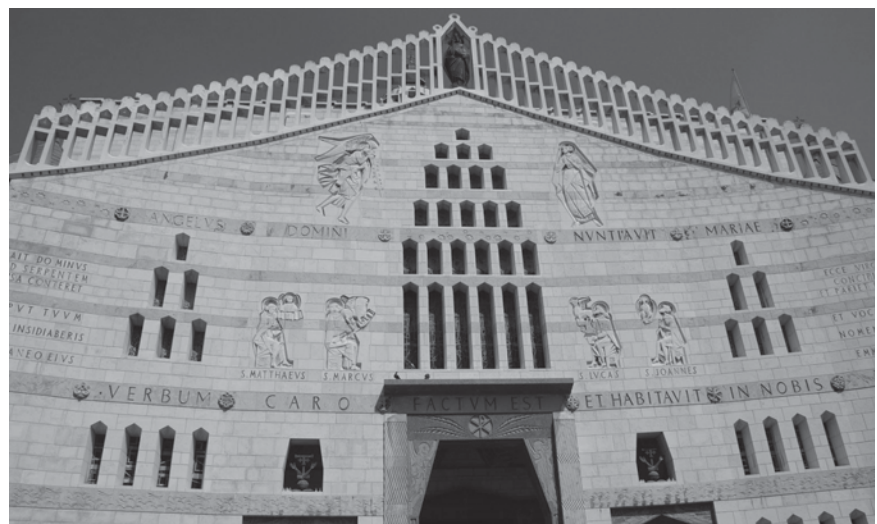
Nazareth, Basilica dell'Annunciazione.

In questa che è la città dell'Annunciazione, il nostro pensiero si volge a Maria, "piena di grazia", la Madre della Santa Famiglia e nostra Madre. Nazareth ci ricorda il dovere di riconoscere e rispettare dignità e missione concesse da Dio alle donne, come pure i loro particolari carismi e talenti. Sia come madri di famiglia, una vitale presenza nella forza lavoro e nelle istituzioni della società, sia nella particolare chiamata a seguire il Signore mediante i consigli evangelici di castità, povertà e obbedienza, le donne hanno un ruolo indispensabile nel creare quella "ecologia umana" (cfr. Centesimus annus , 39) di cui il mondo, e anche questa terra, hanno così urgente bisogno: un ambiente in cui i bambini imparino ad amare e ad apprezzare gli altri,